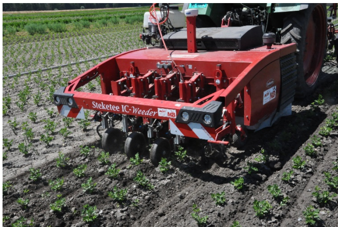
Abbildung 2: Testfahrt mit dem Pflanzenschutzroboter in gepflanztem Sellerie.

Im zweiten Projektjahr liefen Versuche in Pak-Choi (Abbildung 1) und nochmals in Salat. Erste Testfahrten erfolgten auch in gepflanzter Petersilie, Bundzwiebeln und Sellerie (Abbildung 2). Gleichzeitig wurden Parameter wie Deckungsgrad, Blattfläche und Gewicht über die Kulturdauer der verschiedenen Gemüsearten erhoben. Dies mit dem langfristigen Ziel, die Wassermenge in Abhängigkeit vom Kulturstadium zu optimieren. In frühen Kulturstadien mit geringer Blattfläche kann sich am Pflanzenbestand beispielsweise nur ein geringer Anteil der Brühmenge anlagern. Daher könnte die Brühmenge entsprechend reduziert werden. Später im Kulturverlauf, bei grösserer Blattfläche, kann die Brühmenge dann wieder erhöht werden.