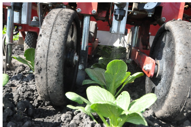
Abbildung 1: Behandlung mit dem Pflanzenschutzroboter in Pak-Choi in 2019. Trotz wöchentlicher Behandlungen wiesen die Blätter Lochfrass durch Erdflöhe auf. Dies kann auch auf den sehr hohen Erdflodruck auf dem Feld und in dem Jahr zurückgeführt werden.

Im Rahmen des breit abgestützten AgriQnet Projekts «Ressourcenschonender, nachhaltiger Pflanzenschutz im Gemüsebau durch kameragesteuerte Pflanzenschutzroboter» wurde ein Prototyp basierend auf einem bereits existierenden Hackroboter entwickelt. Dieser behandelt gezielt nur die Kulturpflanzen mit Pflanzenschutzmitteln. Diese Art der Pflanzenschutzmittelanwendung wird als Spot Spraying bezeichnet.